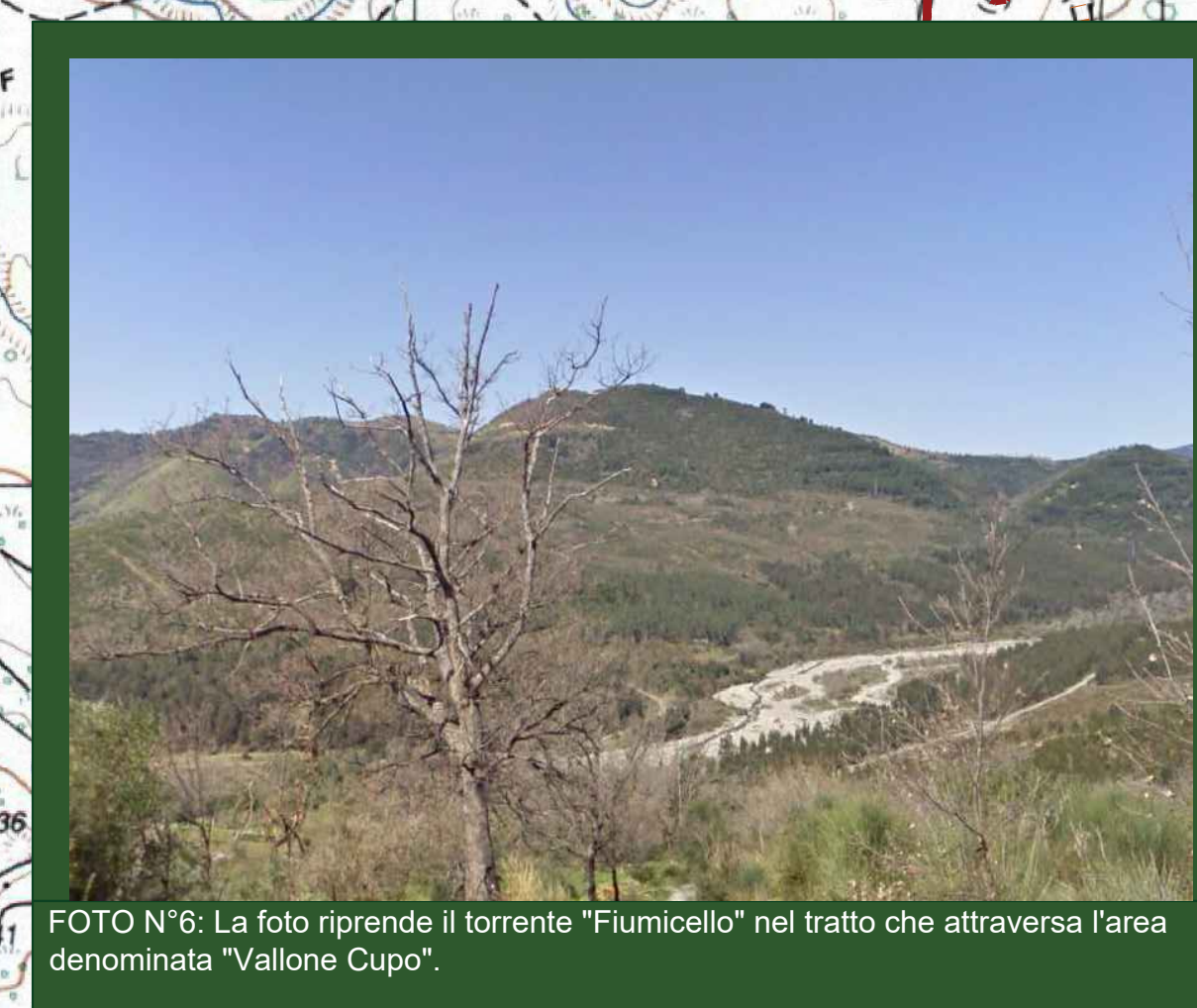
FOTO N°6: La foto riprende il torrente "Fiumicello" nel tratto che attraversa l'area denominata "Vallone Cupo".