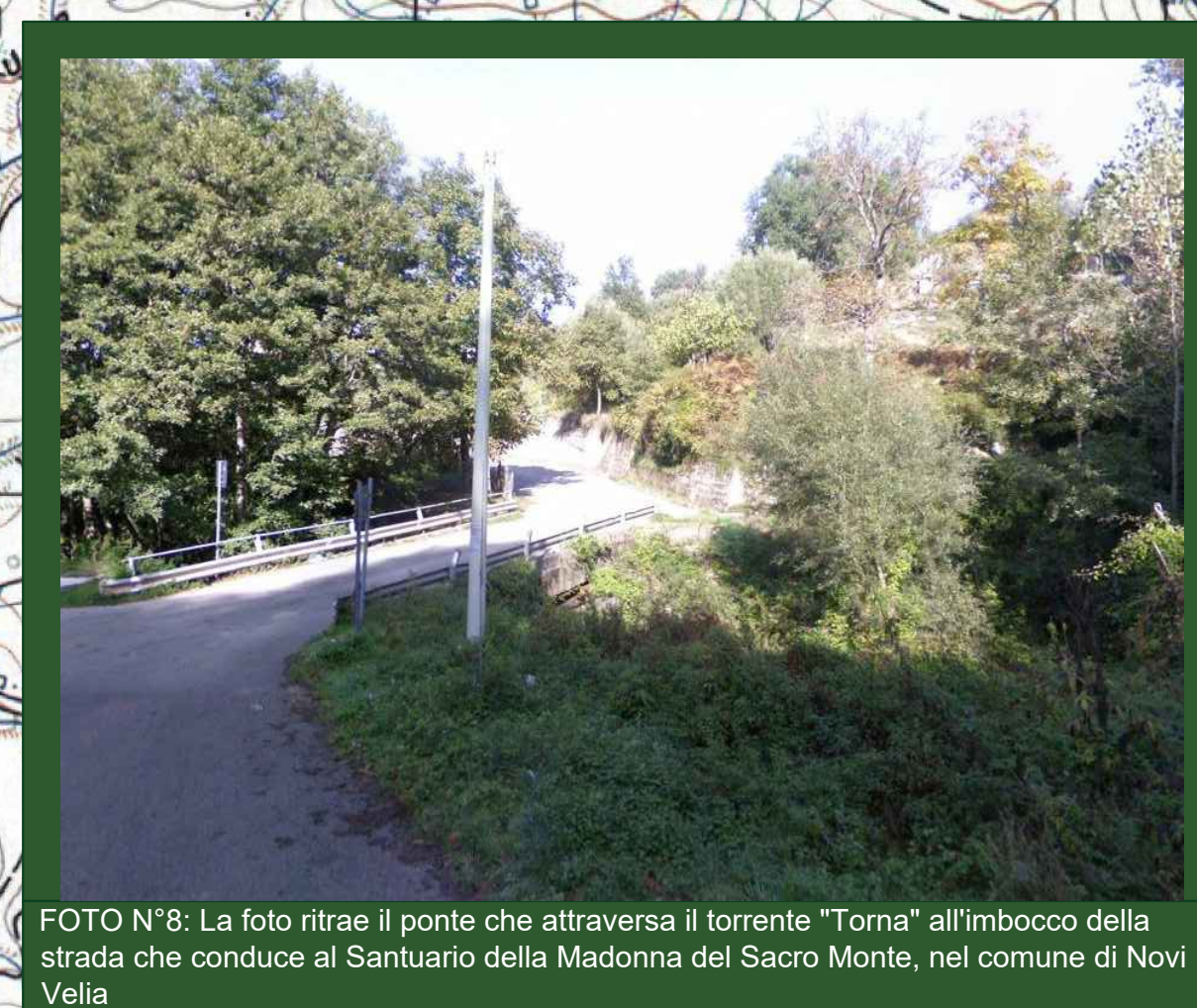
FOTO N°8: La foto ritrae il ponte che attraversa il torrente "Torna" all'imbocco della strada che conduce al Santuario della Madonna del Sacro Monte, nel comune di Novi Velia.