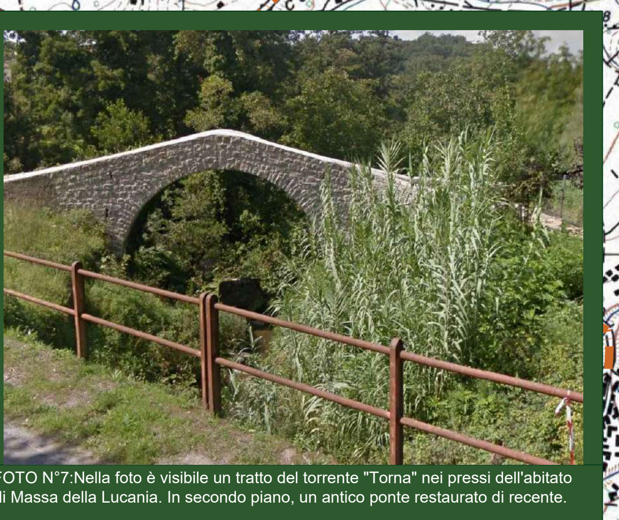
FOTO N°7: Nella foto è visibile un tratto del torrente "Torna" nei pressi dell'abitato di Massa della Lucania. In secondo piano, un antico ponte restaurato di recente.