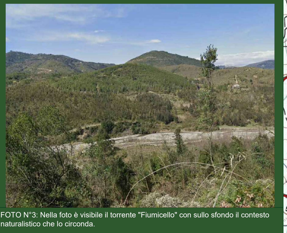
FOTO N°3: Nella foto è visibile il torrente "Fiumicello" con sullo sfondo il contesto naturalistico che lo circonda.