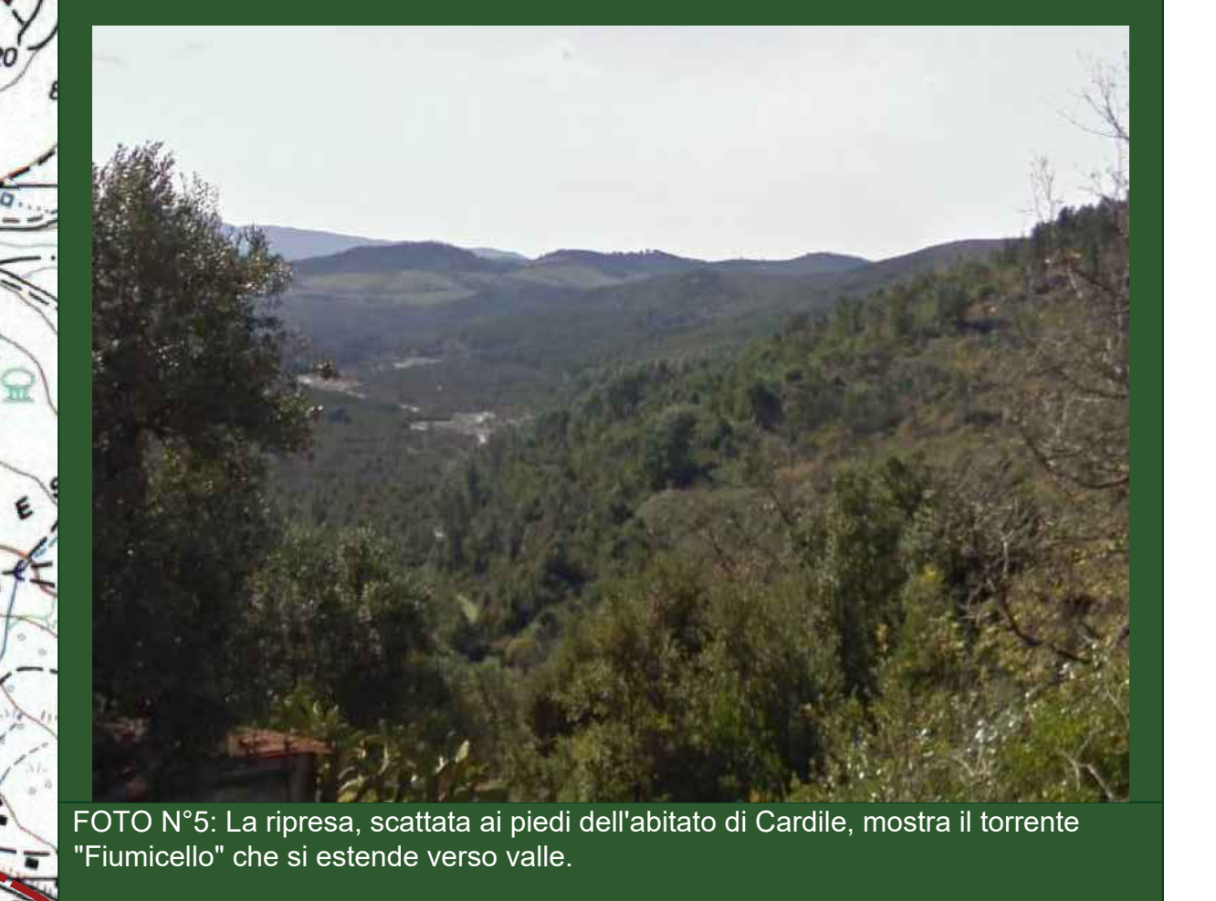
FOTO N°5: La ripresa, scattata ai piedi dell'abitato di Cardile, mostra il torrente "Fiumicello" che si estende verso valle.