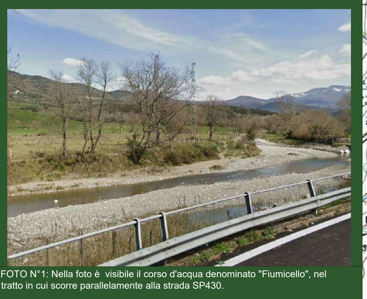
FOTO N°1: Nella foto è visibile il corso d'acqua denominato "Fiumicello", nel tratto in cui scorre parallelamente alla strada SP430.