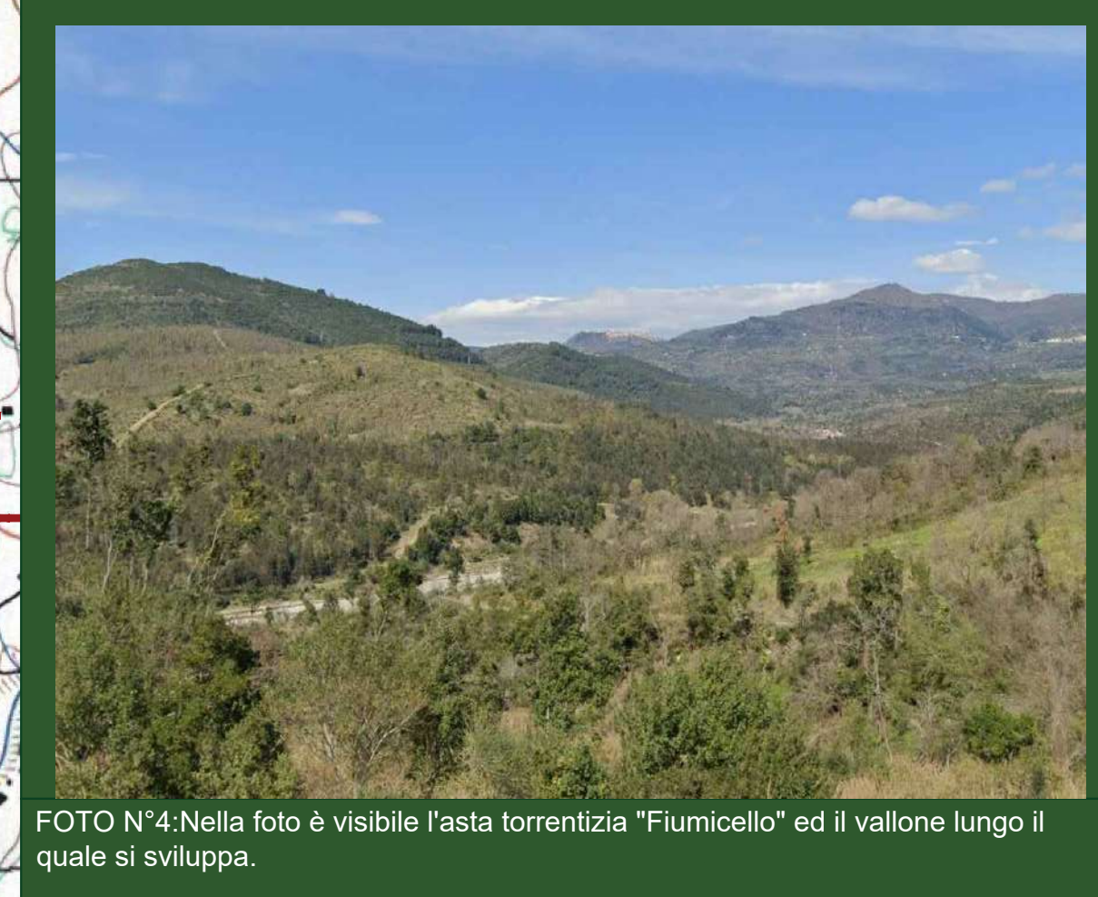
FOTO N°4: Nella foto è visibile l'asta torrentizia "Fiumicello" ed il valone lungo il quale si sviluppa.