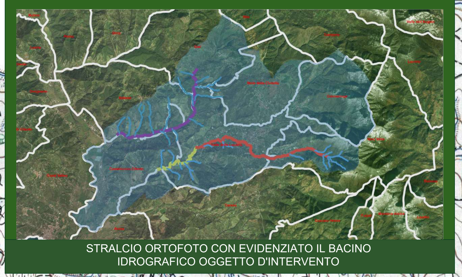
STRALCIO ORTOFOTO CON EVIDENZIATO IL BACINO IDROGRAFICO OGGETTO D'INTERVENTO