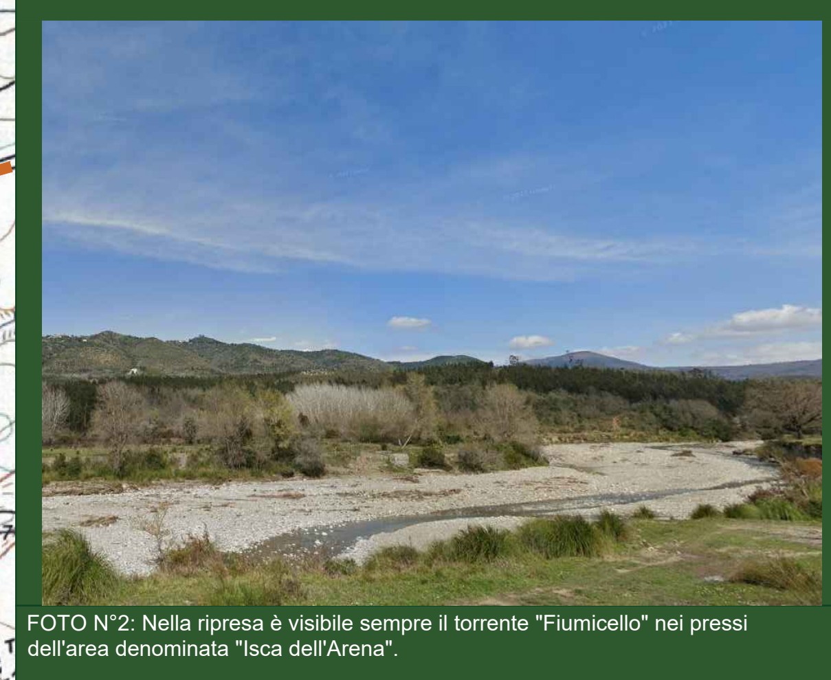
FOTO N°2: Nella ripresa è visibile sempre il torrente "Fiumicello" nei pressi dell'area denominata "Isca dell'Arena".